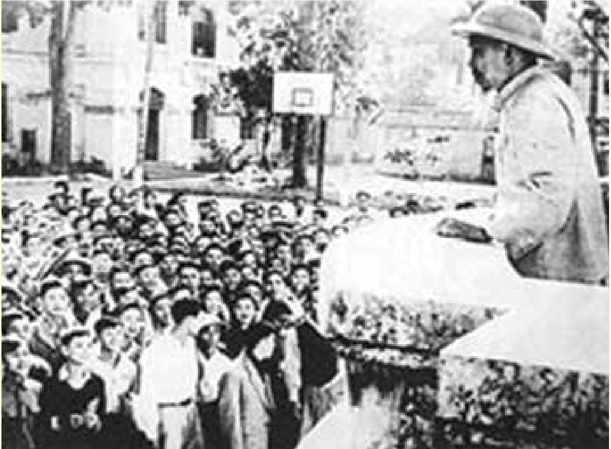
Chủ tịch Hồ Chí Minh với cán bộ sinh viên Trường Đại học Tổng hợp Hà Nội

được lan tỏa và thức tỉnh tuổi trẻ sẽ có thể bùng phát thành những cơn bão táp chống lại chế độ thuộc địa. Do vậy, cùng với hành động đàn áp bằng bạo lực dã man là biện pháp lôi cuốn thanh niên vào trường học nhằm biến họ thành công cụ phục vụ nền cai trị thực dân, đi ngược lại lợi ích dân tộc.