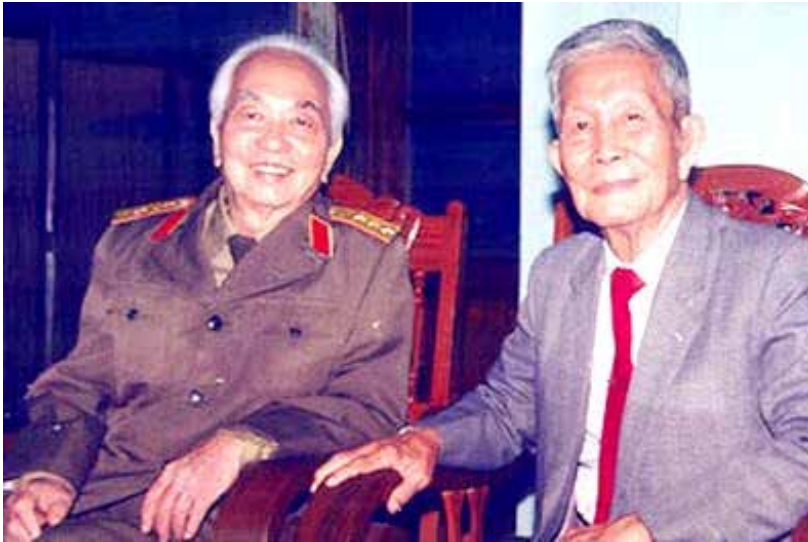
GS. Trần Văn Giàu trong lần gặp Đại tướng Võ Nguyên Giáp

Thanh niên Tiên phong có vai trò to lớn trong quá trình gấp rút chuẩn bị và tiến lên tổng khởi nghĩa giành chính quyền ở Sài Gòn và các tỉnh Nam Bộ Tháng Tám năm 1945. Thực tiễn đó chứng minh rằng chủ trương của Bí thư Trần Văn Giàu và Xứ uỷ Nam Kỳ là hoàn toàn đúng đắn.