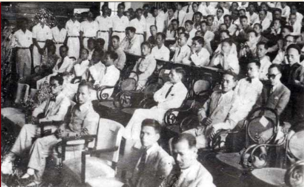
Chủ tịch Hồ Chí Minh chủ tọa buổi khai giảng Đại học Quốc gia Việt Nam ngày 15/11/1945 tại giảng đường Đại học Đông Dương

phải theo ít nhất là 5 lớp văn học. Sinh viên Ban Khoa học cũng phải theo học tối thiểu là 5 lớp khoa học. Sinh viên Ban Luật phải theo tất cả các lớp luật và ít nhất là một lớp văn học. Tất cả các sinh viên đều phải học tiếng Pháp, họ cũng có thể đăng ký vào các lớp khác thậm chí là vào một ban khác. Các lớp thực hành dành riêng cho sinh viên Ban Khoa học.