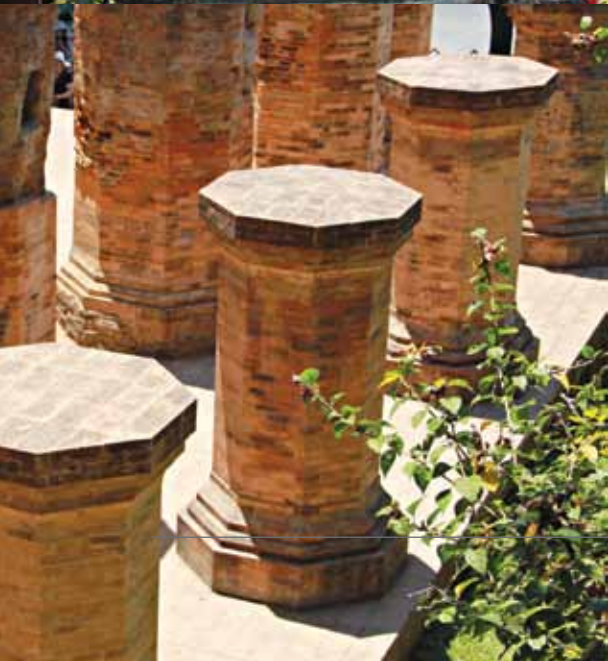
>> Các chi tiết kiến trúc của tháp Po Nagar