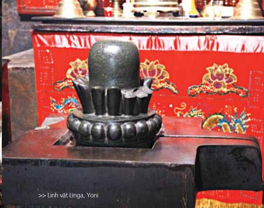
>> Linh vật Linga, Yoni