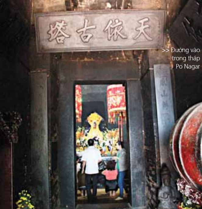
>> Đường vào trong tháp Po Nagar