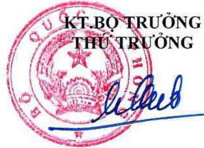
Trung tướng Phan Văn Giang