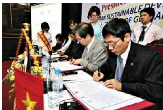
>> Bốn Giám đốc ký Tuyên bố chung

Trên cơ sở đó, Giám đốc 4 đại học đã cùng nhau thảo luận những việc chính để sớm hiện thực hóa các ý tưởng, trong đó nhấn mạnh cách thức thực hiện, chỉ đạo, tăng cường chia sẻ thông tin đến việc xây dựng