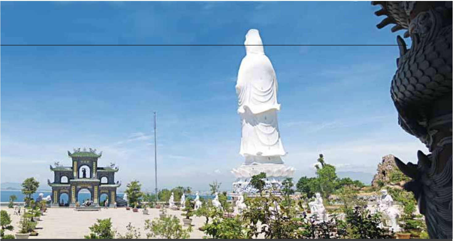
>> Nhìn xuống vịnh Đà Nẵng