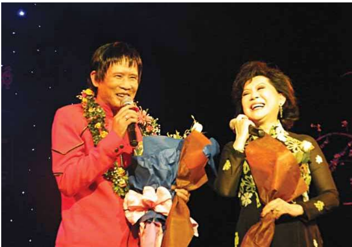
&gt;&gt; Ca sĩ Tuấn Vũ và ca sĩ Giao Linh