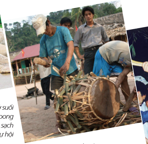
>> Làm trống hội