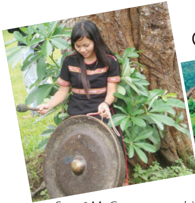
>> Son nữ Ma Coong rạo rục chờ đêm hội tình