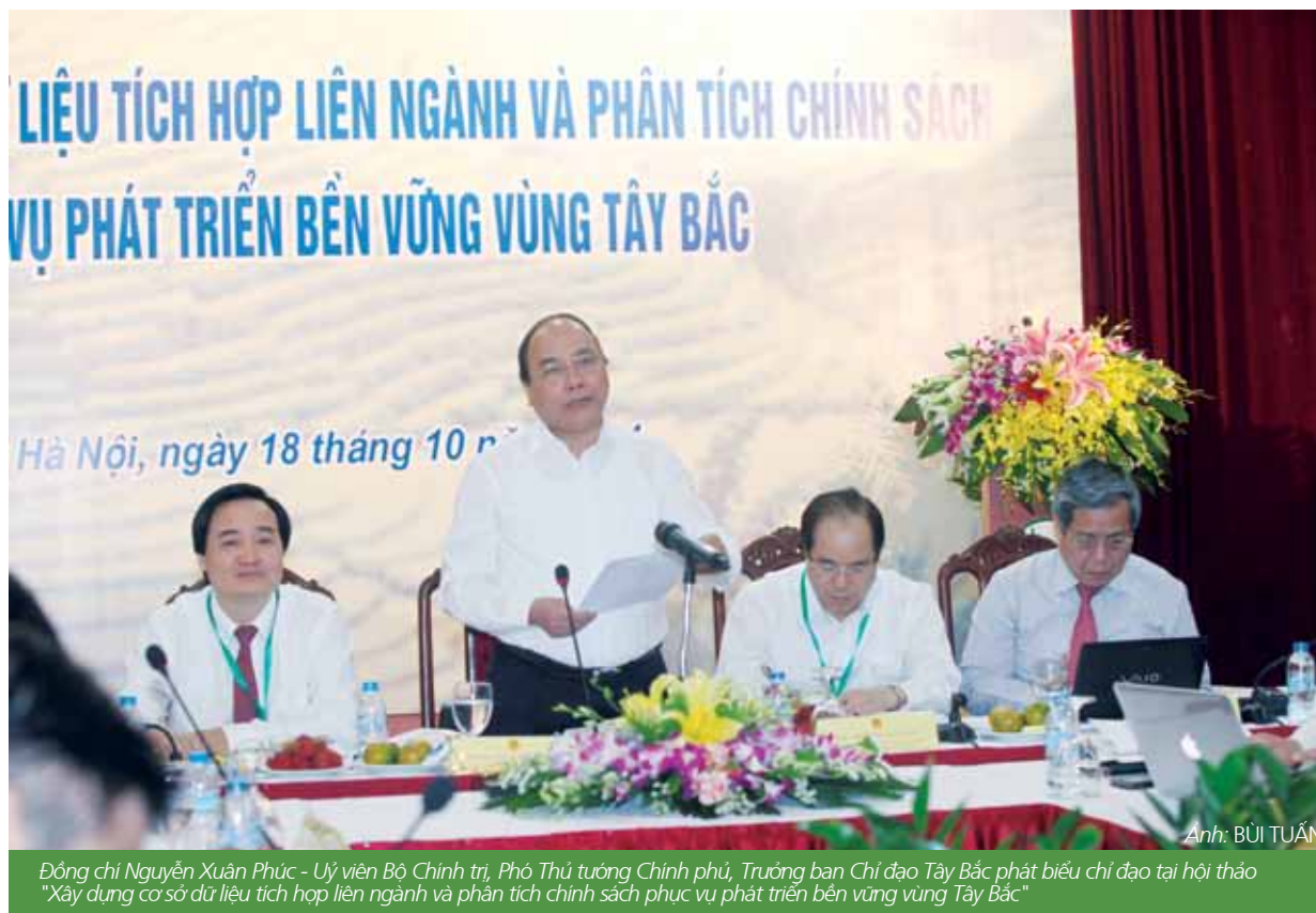
Đồng chí Nguyễn Xuân Phúc - Ủy viên Bộ Chính trị, Phó Thủ tướng Chính phủ, Trưởng ban Chỉ đạo Tây Bắc phát biểu chỉ đạo tại hội thảo "Xây dựng cơ sở dữ liệu tích hợp liên ngành và phân tích chính sách phục vụ phát triển bền vững vùng Tây Bắc"

ĐHQGHN đã ý thức rõ trách nhiệm lớn lao của mình trước Đảng, Chính phủ, trước các tỉnh trong khu vực Tây Bắc, đặc biệt là tình cảm và trách nhiệm trước đồng bào các dân tộc vùng Tây Bắc. Do vậy, ĐHQGHN quyết tâm thực hiện có hiệu quả Chương trình này.