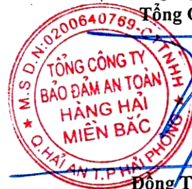
Đông Trung Kiên