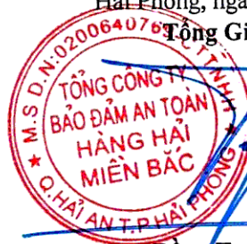
Đông Trung Kiên