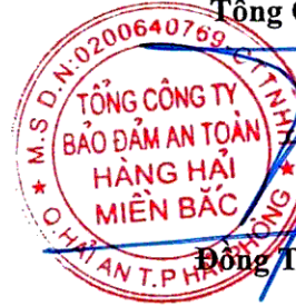
Đông Trung Kiên