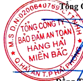
Đông Trung Kiên