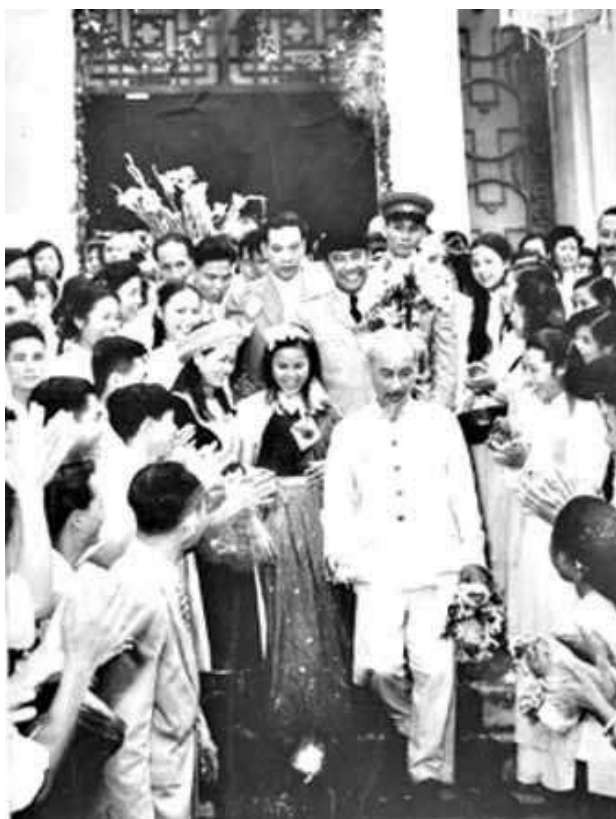
>> Bác Hồ đến thăm Trường Đại học Tổng hợp Hà Nội (nay là ĐHQGHN)

tháng Tám, Đại học Đông Dương đã là một đại học hiện đại đa ngành, đa lĩnh vực có uy tín ở Viễn Đông, có quy mô đào tạo đạt tới hơn 1000 sinh viên/năm. Một số ngành đạt chất lượng quốc tế.