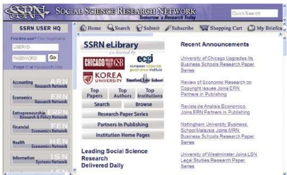
Giao diện của website "Mạng nghiên cứu khoa học xã hội"