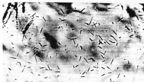
Hình 2. Các vết sinh ra do phân hạch tự nhiên của urani-238

Các tia vũ trụ là nguồn hạt năng lượng cao bắn phá thường xuyên vào khí quyển; chúng gồm proton, neutron và những hạt khác có tốc độ rất cao. Nguồn gốc của chúng chưa được biết rõ nhưng chắc là chúng đã đến từ những thiên hà rất xa. Khi vào khí quyển các tia vũ trụ đụng độ với các phân tử khí của khí quyển và sinh ra nhiều loại nguyên tử phóng xạ. Những nguyên tử này tham gia vào nhiều chu kỳ địa chất và sinh học, cho ta khả năng sử dụng để định tuổi nhiều sự kiện khá trẻ trong lịch sử Trái Đất [B.2]. Một số tia vũ trụ xuyên vào trong đá của bề mặt Trái Đất đến độ sâu 1m và sinh ra các nguyên tử phóng xạ có thể sử dụng để định tuổi các bề mặt bào mòn trẻ.